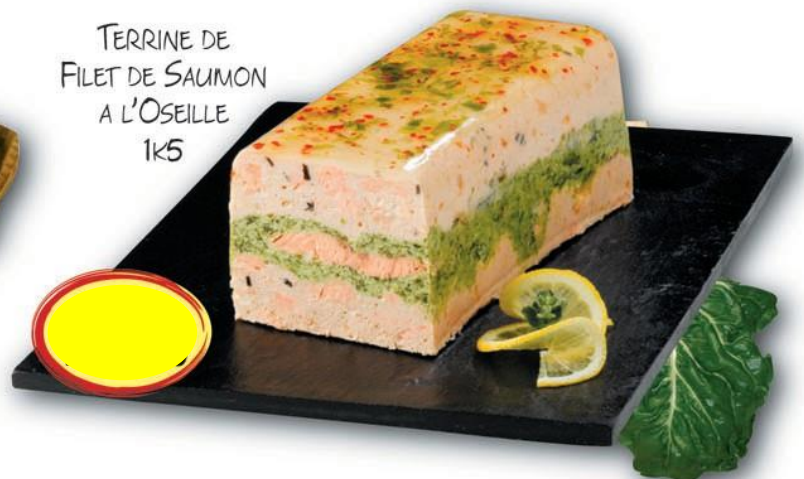
TERRINE DE FILET DE SAUMON A L'OSEILLE 1K5