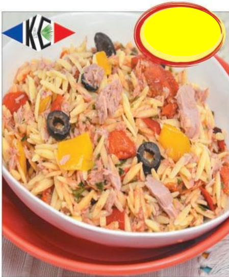
RISONI THON ET POIVRONS GRILLÉS 1K5