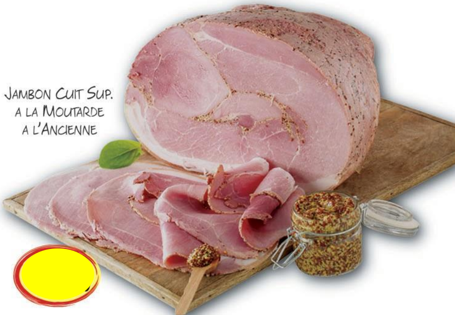
JAMBON CUIT SUP. A LA MOUTARDE A L'ANCIENNE