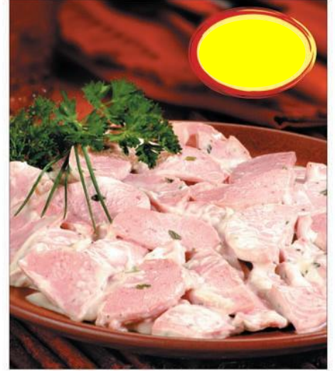
CERVELAS SAUCE REMOULADE 2K5