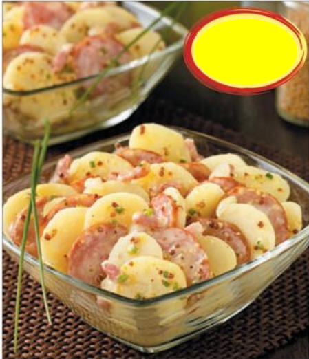
SALADE MONTBELIARDE 2K5

SALAISONS BOURBONNAISES 52400 BOURBONNE LES BAINS Tél 03 25 90 19 49 • Fax 03 25 90 18 66