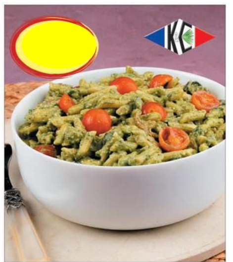
MINI PENNE PESTO CITRON VERT 1K5