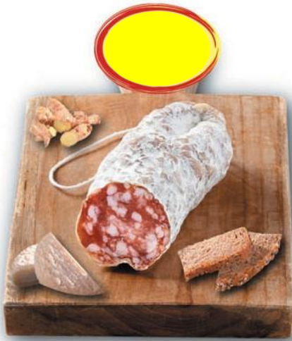
SAUCISSON SEC AU CHÈVRE BN 150G x 6

ANDOUILLETES DE TROYES SUPERIEURES TRONCONNÉES 160G x 8