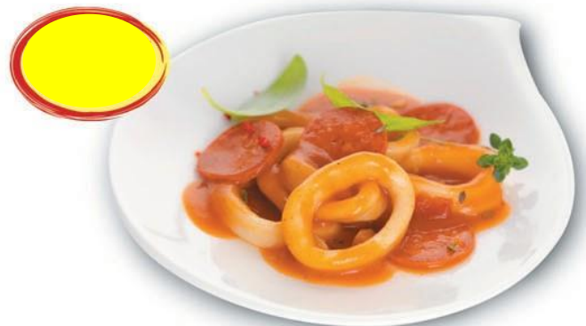
POELÉE DE CALAMARS A LA CATALANE 2K - 10 PARTS 200G