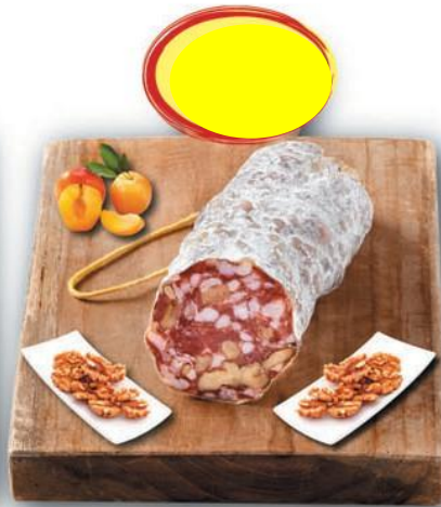
SAUCISSON SEC AUX NOIX BN 150G x 6