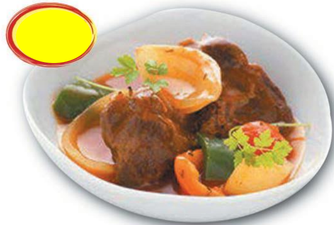
JOUE DE BOEUF SAUCE PIPERADE 2K3 - 10 PARTS 230G