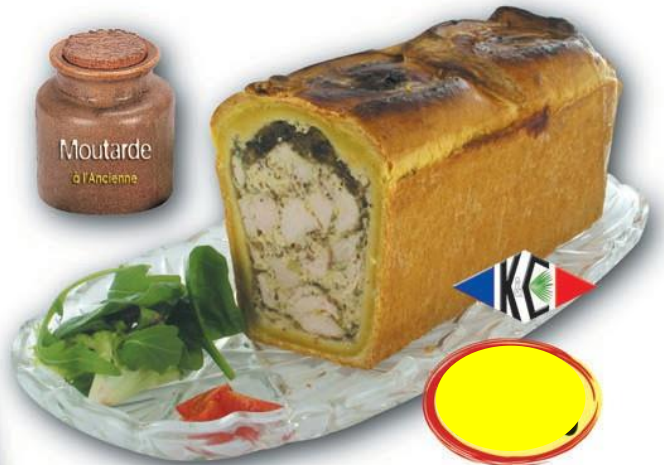
1/2 PAÉ CROUTE BLANC DE POULET MOUTARDE A L'ANCIENNE