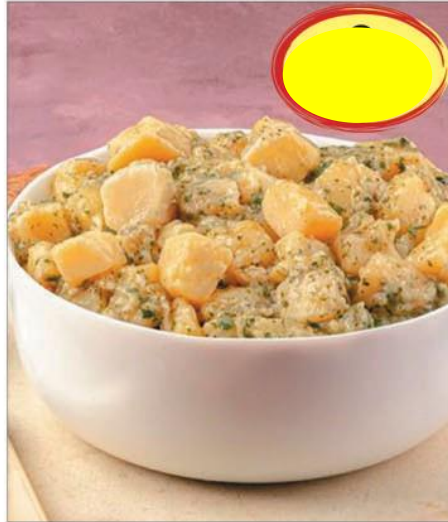
POMMES DE TERRE PERSILLÉES 1K5