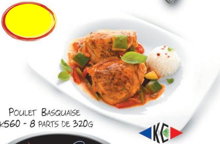
POULET BASQUAISE 2K560 - 8 PARTS DE 320G