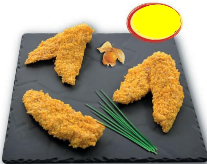
AIGUILLETES DE POULET PANÉES ENV.1K S/AT LE GAULOIS PROFESSIONNEL