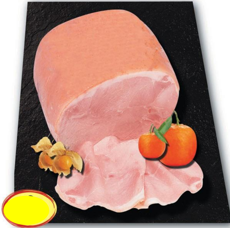
JAMBON CUIT SUPÉRIEUR AC LE TROINOIX