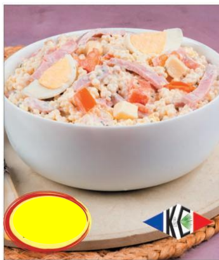
PERLES JAMBON OEUF EMMENTAL 1K5