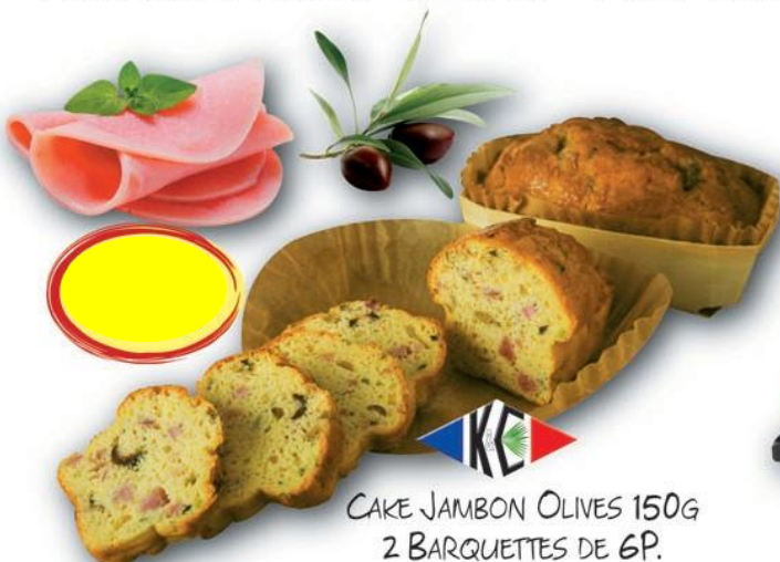
CAKE JAMBON OLIVES 150G 2 BARQUETTES DE 6P.