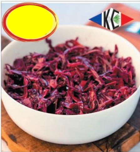
CHOU ROUGE ET CAROTTES 2K5