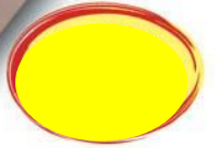
1/2 PATÉ CROUTE BRESSAN 2K