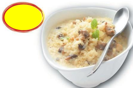
RISOTTO AL PARMIGIANO DOP 1K5 - 10 PARTS DE 150G