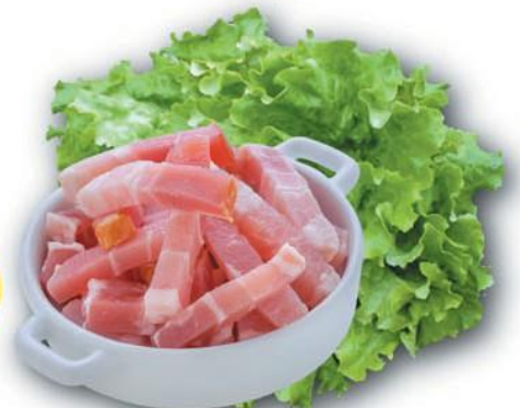
LARDONS CRUS FUMÉS BARQ 1K PF 5X5X25 S/GAZ