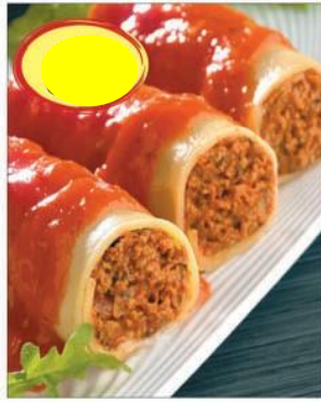
CANELONI A LA BOLOGNAISE VF 2K5