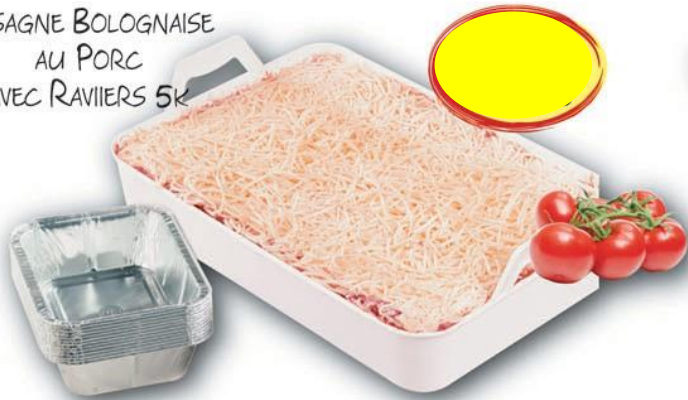
LASAGNE BOLOGNAISE AU PORC AVEC RAVIERS 5K