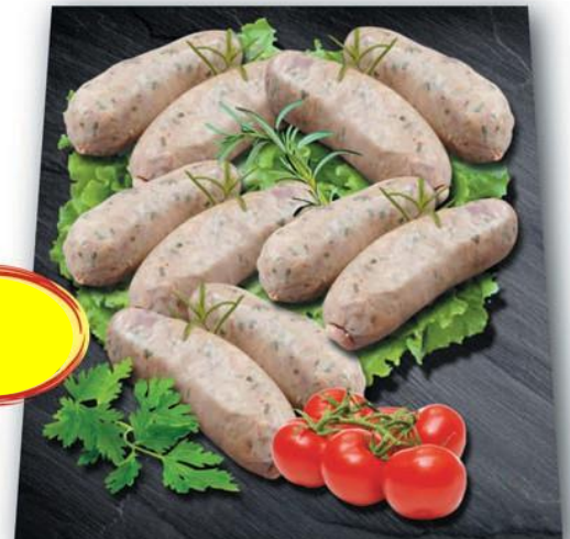
ANDOUILLETES AU CANARD 130G S/V PAR 10