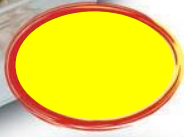
TERRINE DE CAMPAGNE A L'ANCIENNE 2K5