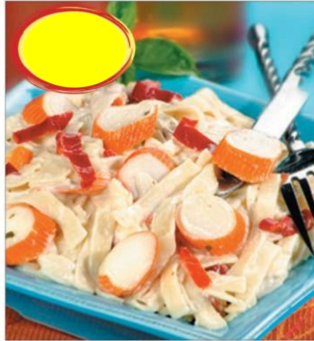
TAGLIATELLES AU SURIMI 2K5