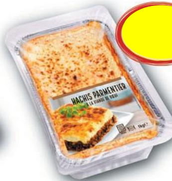
HACHIS PARMENTIER 1K x 4