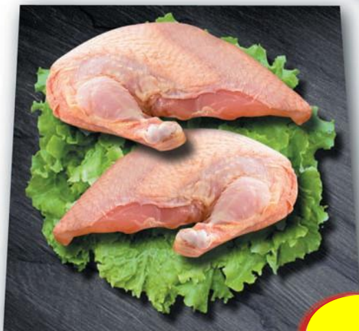
SUPRÊME DE POULET 160/200 ET 200/240 S/V x 10