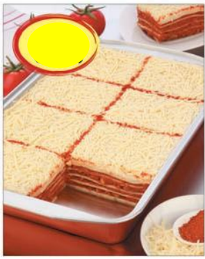
LASAGNE EMMENTAL TRACÉE VIANDE DE BOEUF FRANCE 3K