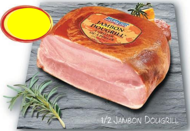
1/2 JAMBON DOUGRILL