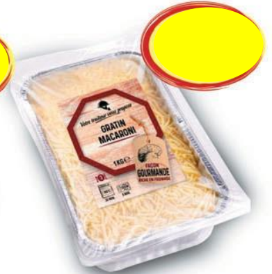
GRATIN DE MACARONI AU JAMBON 1K x 4