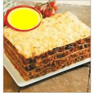
LASAGNE LÉGUMES 3K