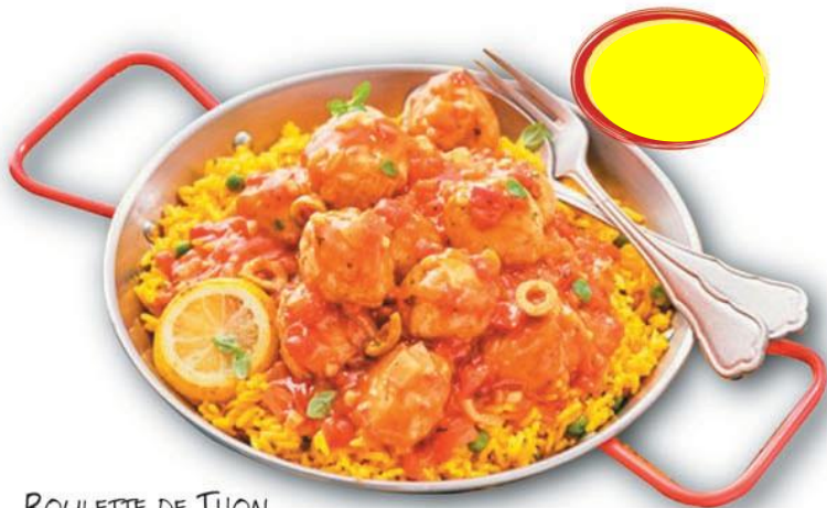
BOULETTE DE THON A LA CATALANE 2K2 - 10 PARTS 275G