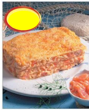
LASAGNE AU SAUMON 3K