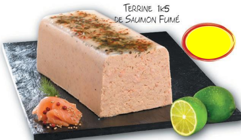
TERRINE 1K5 DE SAUMON FUMÉ