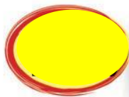
CUISSÉ DE PINTADE DÉJOINTÉE VRAC NU S/V x 10 150/180- 180/220