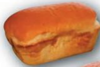
SAUCISSON BRIOCHÉ 120G PISTACHÉ 2% 2 x 6 P