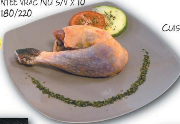
CUISSÉ DE PINTADE DÉJOINTÉE VRAC NUE 150/180 - 180/220