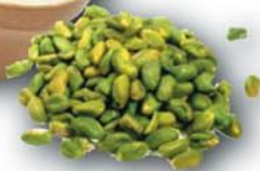
TERRINE LAPIN FRANCAIS PISTACHE MÉDAILLON FOIE GRAS 3K5