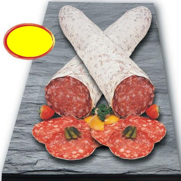
ROSETTE DE LYON SUP. PUR PORC 3K