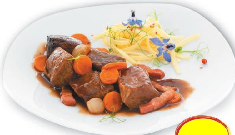
GARDIANE DE TAUREAU 2K4 10 PARTS DE 240G