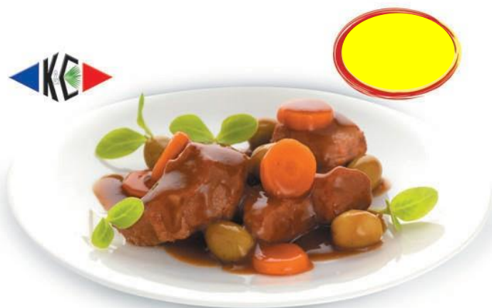
CIVET DE PORC AUX OLIVES 2K070 - 9 PARTS DE 230G