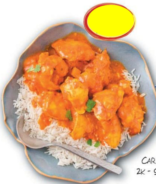
CARI DE POULET 2K - 9 PARTS 220G