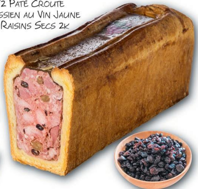
1/2 PATÉ CROUTE JURASSIEN AU VIN JAUNE ET RAISINS SECS 2K