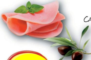
CAKE JAMBON OLIVES 150G 2 BARQUETTES DE 6P.