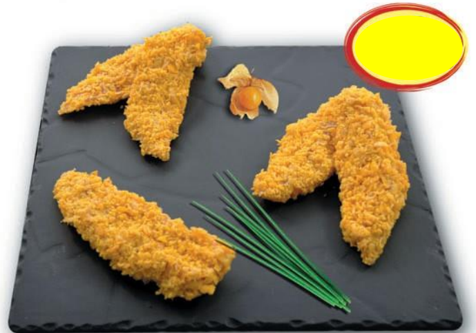
AIGUILLETES DE POULET PANÉES ENV.1K S/AT LE GAULOIS PROFESSIONNEL