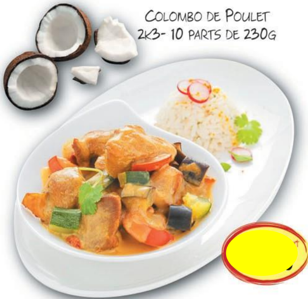
COLOMBO DE POULET 2K3 - 10 PARTS DE 230G