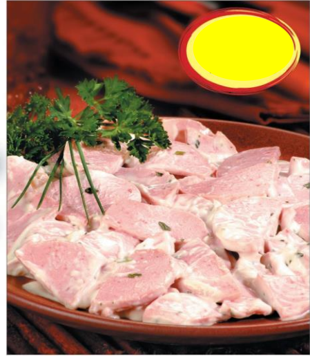
CERVELAS SAUCE REMOULADE 2K5