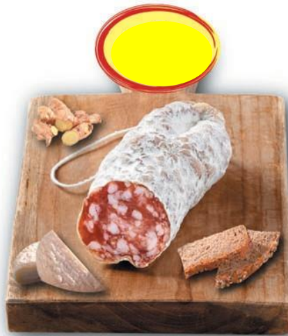
SAUCISSON SEC AU CHÈVRE BN 150G X 6