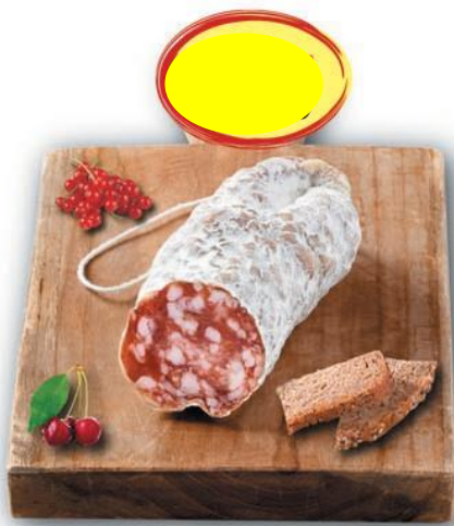
SAUCISSON SEC SEL DE GUÉRENDE BN 150G X 6