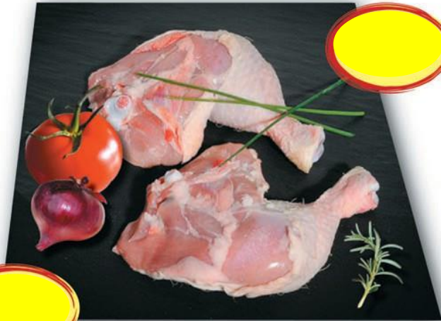
CUISSE DE POULET DÉJOINTÉE VRAC NUE 180/200 - 200/220 - 220/240 - 240/260