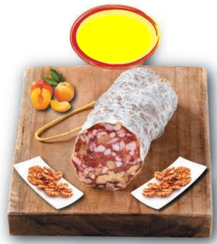
SAUCISSON SEC AUX NOIX BN 150G X 6