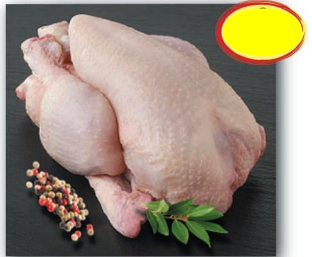
COQUELET 500-650G PAC NU