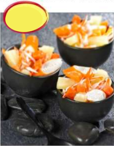
DUO ANANAS CAROTTE SURIMI 2k5