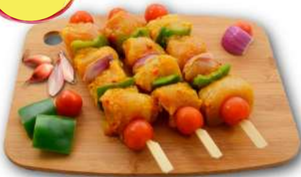
BROCHETTE FILET DE POULET A L'ESPAGNOLE QUALITÉ BOUCHÈRE 160/180G X 9 S/AT