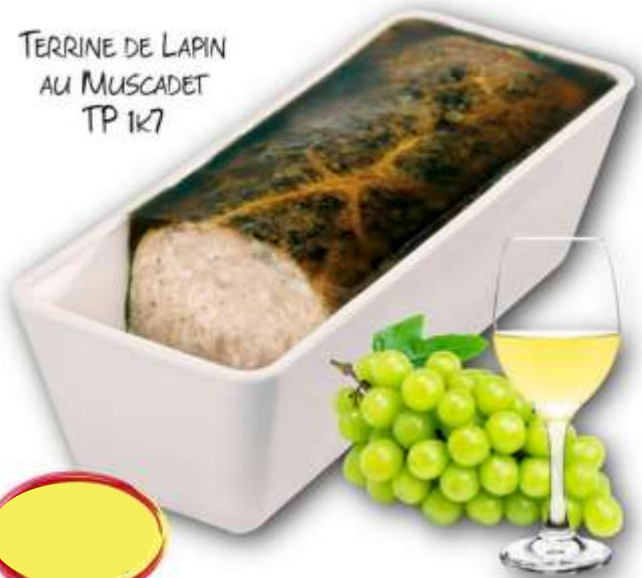
TERRINE DE LAPIN AU MUSCADET TP 1K7