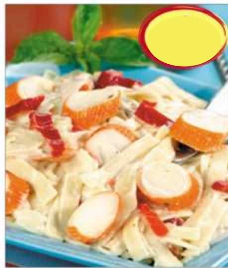
TAGLIATELLES AU SURIMI 2k5