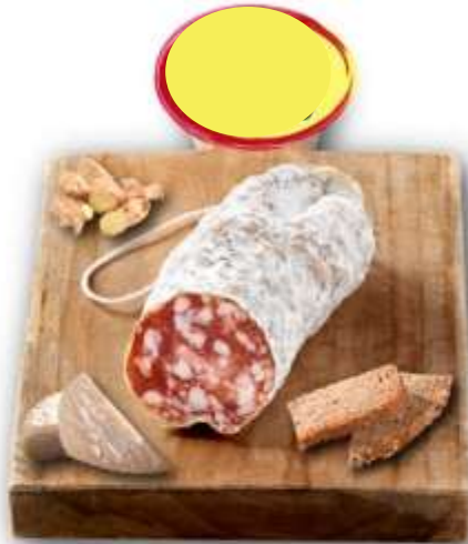
SAUCISSON SEC AU CHÈVRE BN 150G X 6