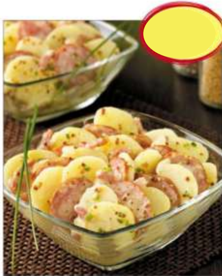
SALADE MONTBÉLIARDE 2k5