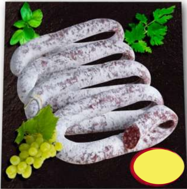
SAUCISSE PERCHE BN QUALITÉ SUP. AVISTOU 3K