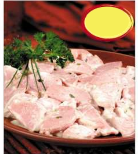
CERVELAS RÉMOULADE 2k5