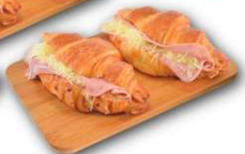
CROISSANT JAMBON FROMAGE 130G x 8