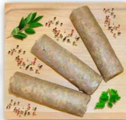
MINI ANDOUILLETTE DE CANARD 110/140G X 10 S/VIDE