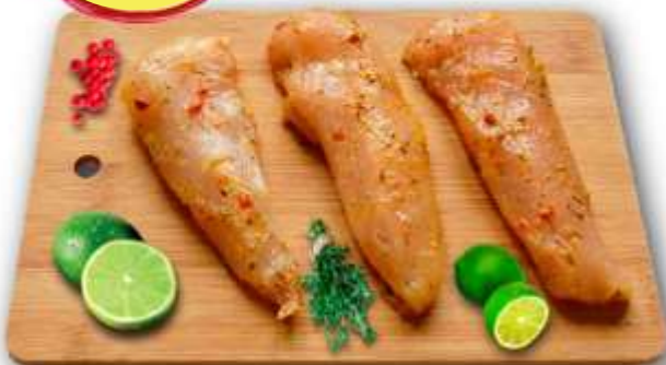
AIGUILLETTE DE POULET THYM CITRON 2K5 S/VIDE