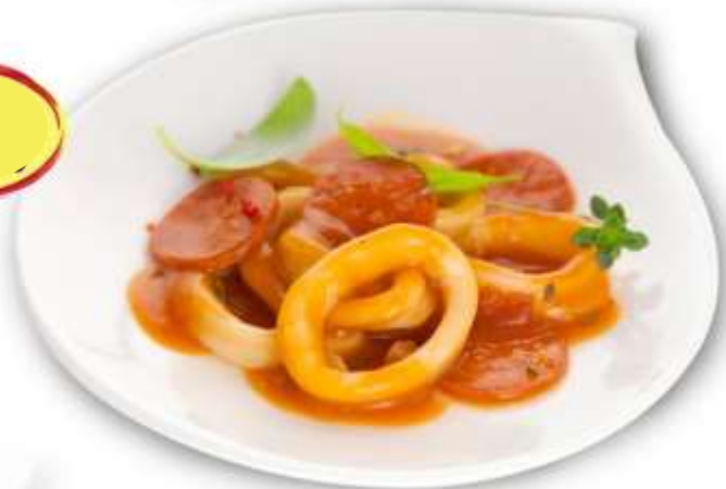
POELÉE DE CALAMARS A LA CATALANE ET CHORIZO 2K - 10 PARTS DE 200G