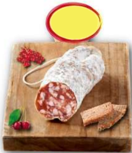
SAUCISSON SEC SEL DE GUÉRENDE BN 150G X 6