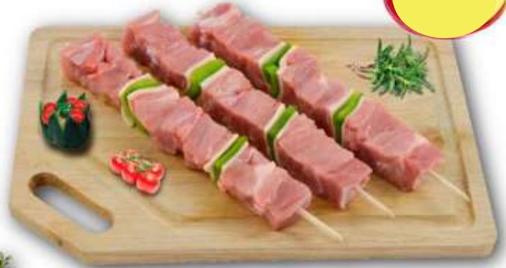
BROCHETTE DINDE POIVRON BARDÉE 140G X 10 S/AT