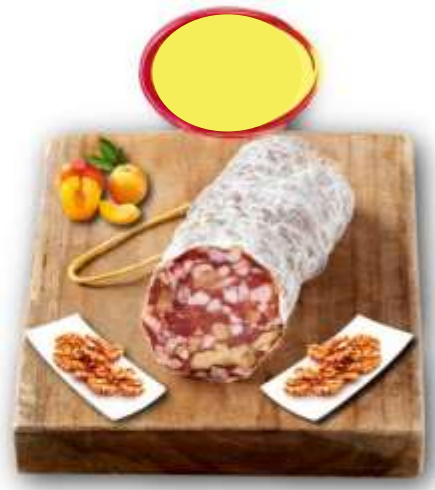
SAUCISSON SEC AUX NOIX BN 150G X 6