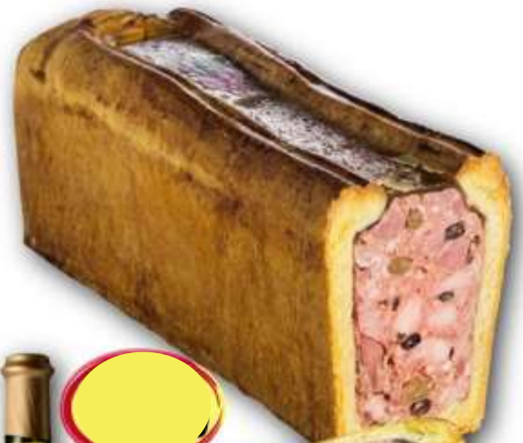
1/2 PATÉ CROUTE JURASSIEN AU VIN JAUNE ET RAISINS SECS 2K