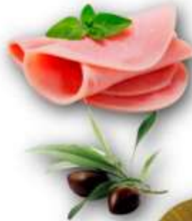
CAKE JAMBON OLIVES 150G