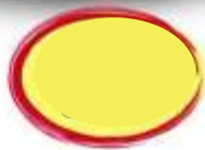
POULET BASQUAISE 2K560 - 8 PARTS DE 320G