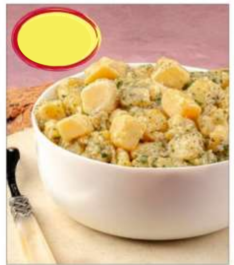
POMMES DE TERRE PERSILLÉES 1k5