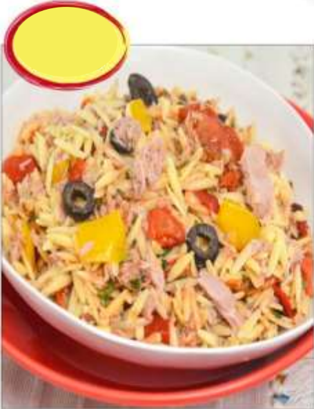
RISONI, THON & POIVRONS GRILLÉS 1k5

SALAISONS BOURBONNAISES 52400 BOURBONNE LES BAINS Tél 03 25 90 19 49 • Fax 03 25 90 18 66