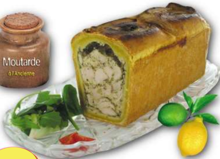
1/2 PATÉ CROUTE POULET AU CITRON ET MOUTARDE A L'ANCIENNE