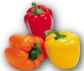
JOUE DE BOEUF SAUCE PIPERADE 2K3 - 10 PARTS DE 230G